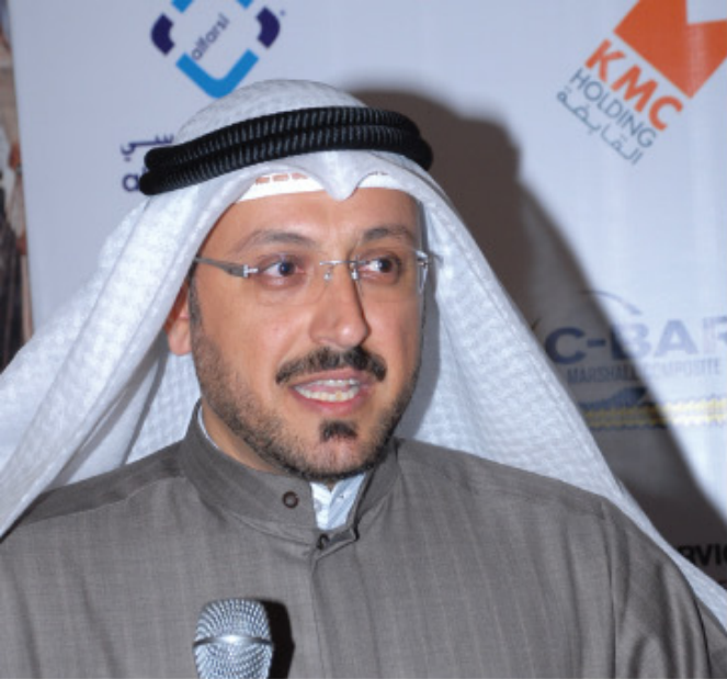
مهندس / طواري المنفي " مدير إدارة التسويق بالصناعات الوطنية "