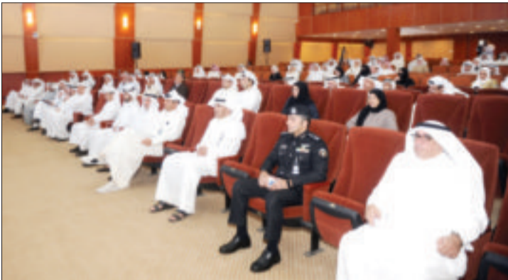
جانب من الحضور

على المتأخرين، أكد أن «القانون نظم له عقوبة معينة، وفي بعض الحالات تصل العقوبة للعزل من الوظيفة، فضلاً عن العقوبات المالية المختلفة».