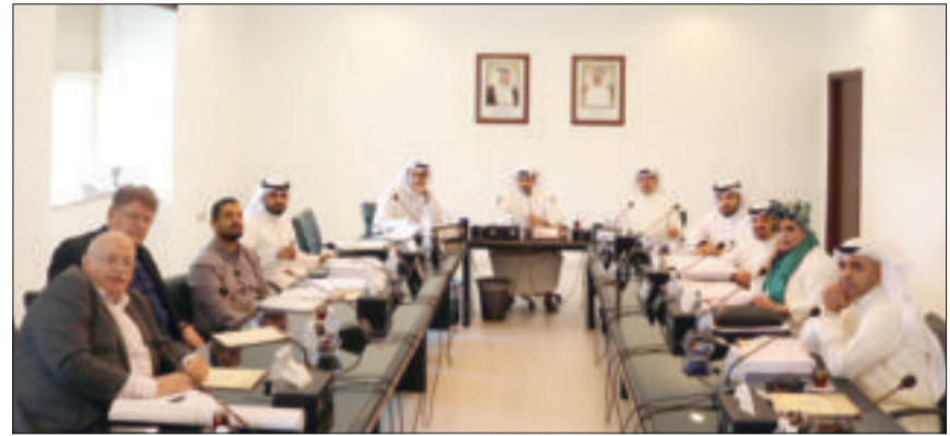
جانب من اجتماع لجنة حولي