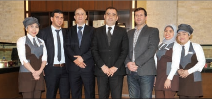
فريق عمل «الخبايز» (قاسم باشا)