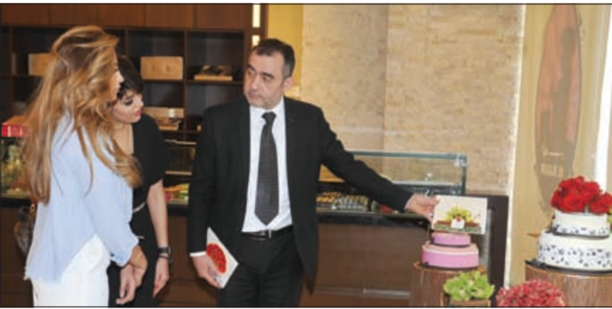
جانب من الجولة للاطلاع على منتجات الخبايز الرائعة

شركة «الخبايز» في تصنيع الكيك والشوكولاتة والجاتو والمكولات الخفيفة والسلطات وغيرها من المأكولات الجاهزة للتقديم.