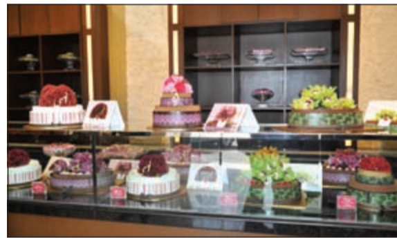
من تشكيلات الخبايز