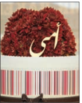
«أمي... كل عام وانت بخير»

للاحتفال بهذا اليوم الأكثر تميزاً، جدير بالذكر أن شركة «الخبايز» شركة وطنية تمتلك 21 فرعاً داخل الكويت، وتم افتتاحها على مدار 20 عاماً، وتخصص