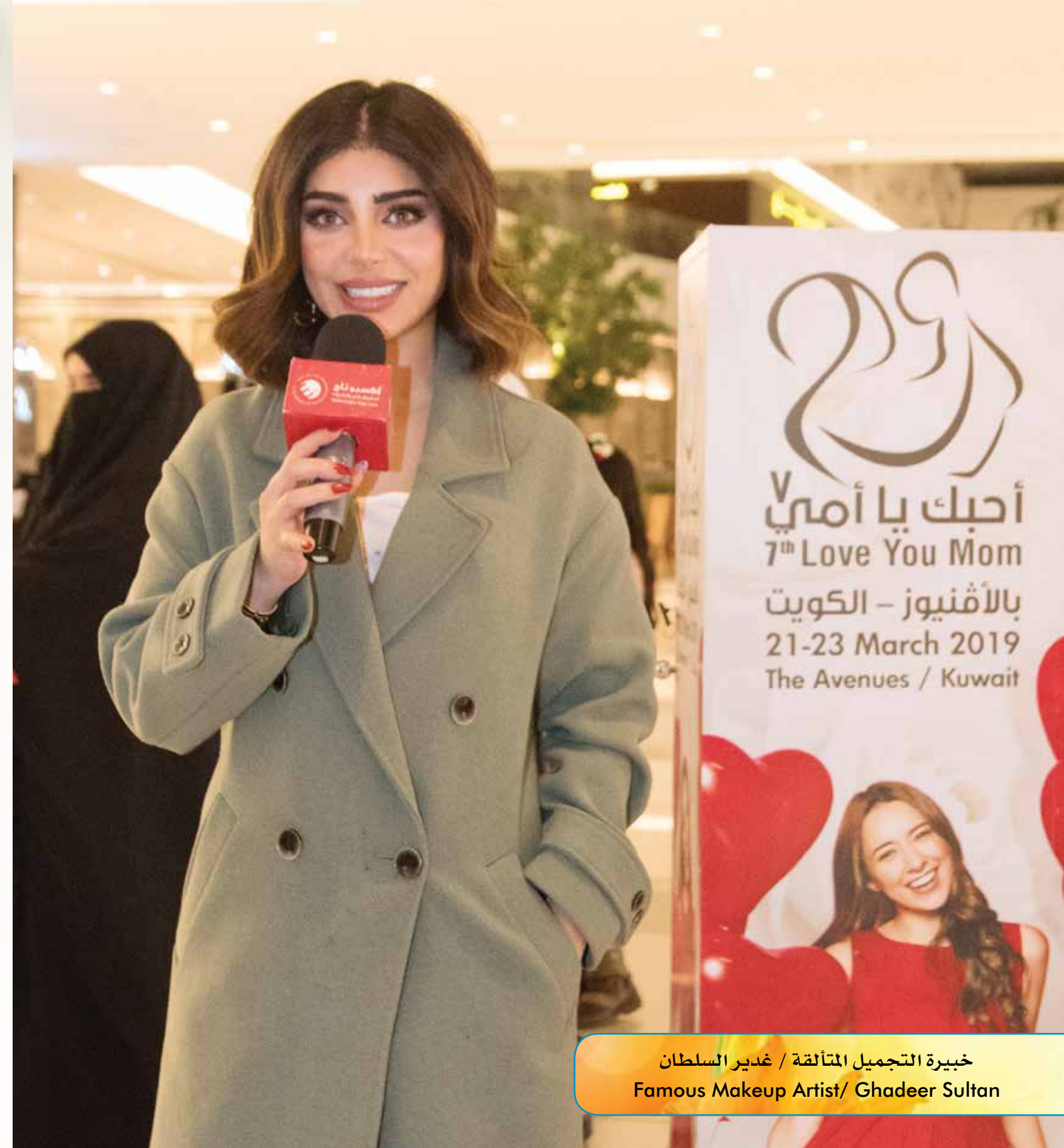
خبيرة التجميل المتألقة / غدير السلطان Famous Makeup Artist/ Ghadeer Sultan